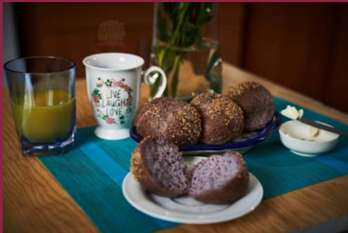
Keto Salado sin Gluten