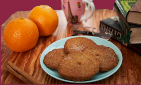
Keto Dulce sin Gluten