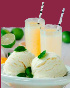
Pay de Limón